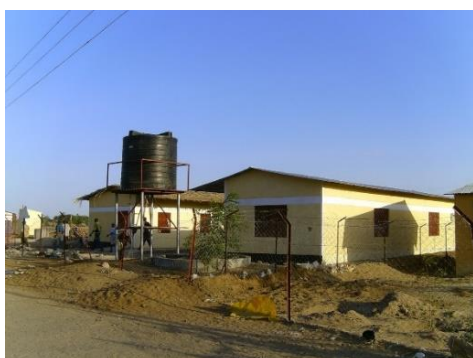
Het Ewoi centrum

Met de aangestelde verpleegkundige en maatschappelijk werkster werd geprobeerd, samen met de huisbezoeksters, voor deze ouderen een iets comfortabeler leven te creëren door voedsel te verstrekken, ziekenhuisbezoek te regelen, soms het bouwen van een hutje van lokaal materiaal en veel andere vormen van hulp die nodig was. Omdat het gehuurde gebouwtje, dat als kantoor diende, op een erg onveilige plek stond, is het gelukt om een eigen gebouw met kantoor- en opslagruimte voor voedsel, een keuken, doucheruimte voor de ouderen en watertanks te bouwen op een perceel van het bisdom n.l. het “Ewoi centrum”. Het is een heel doelmatig gebouw van waaruit alle activiteiten plaats vinden zoals kerstvieringen en Internationale ouderen dag, voedseluitdelingen, voorlichtingsbijeenkomsten, enz.