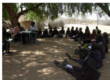
Mobiele kliniek in de bush

Deze workshops worden gesponsord door de landelijke- en regionale vastenactie Nederland.